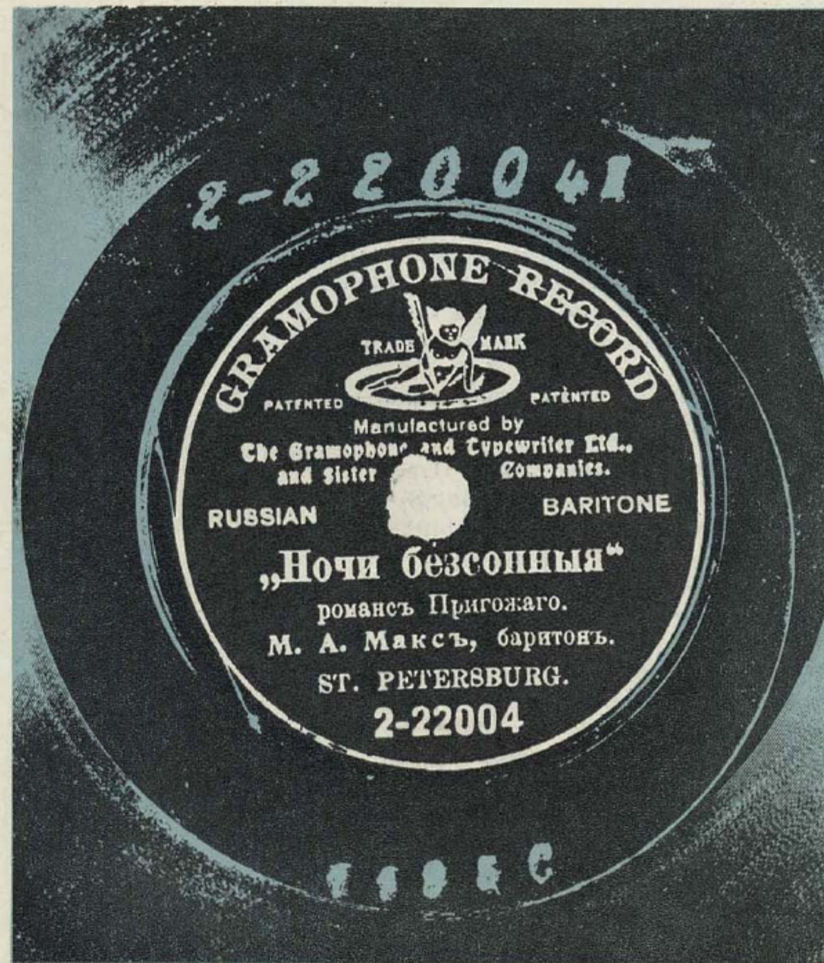
Этикетка грампластинки, записанной М. А. Максом

Из приведенных выше данных следует, что «М. А. Макс», который не был профессионально, как артист, занят в период 1901—1903 годов, — лицо очень близкое к управлению русского филиала Gramophone Company. Более того, можно предположить, что он принадлежал к активу управления: его записывают только в двух главных центрах компании в России, при этом он перемещается из Петер-